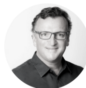
MARTÍN MIGOYA Globant