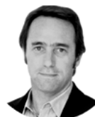
MARCOS GALPERIN MercadoLibre