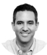
DAVID VÉLEZ Nubank